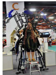
高達3公尺的大型機器人免費試乘。