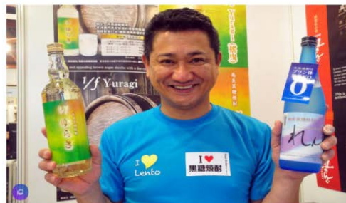
優美大島釀造酒的高純度溫純酒力，吸引許多民眾試飲。