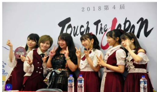
「TOUCH THE JAPAN」邀請多組日本知名團體搖擺表演，粉絲還能近距離互動合照。