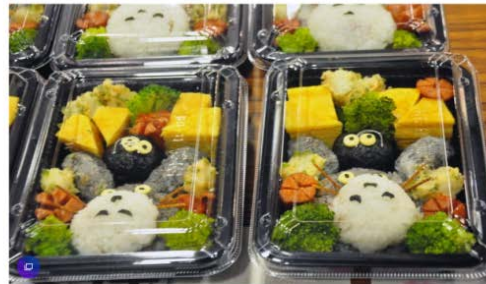
引起眾多民眾讚嘆的日本媽媽卡迪伊當歌聲。