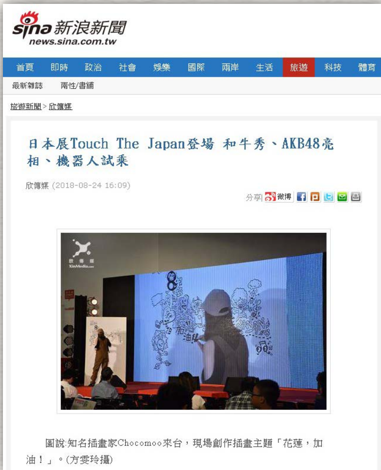
圖說:知名插畫家Chocomoo來台,現場創作插畫主題「花蓮,加油!」。

https://news.sina.com.tw/article/20180824/27959102.html