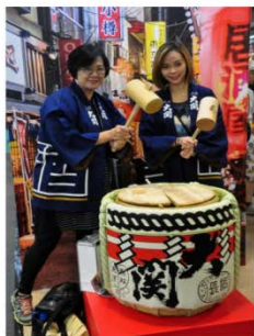
民眾可以與濃濃日本風的器具合照。

「TOUCH THE JAPAN」現場有北海道、京都、北九州等地的最新旅行情報，最受民眾歡迎的免稅綜合型百貨「唐吉珂德」大促銷、「遠地日本和牛料理」秀及現場試吃，甚至吸引起眾多民眾讚嘆的日本媽媽卡迪伊當歌聲、日本傳統優惠特賣，甚至還有高達3公尺的大型機器人免費試乘，以及精彩舞台活動與有機會等，錯過可惜。