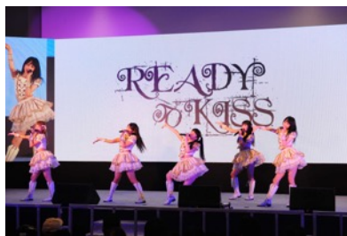
READY TO KISS