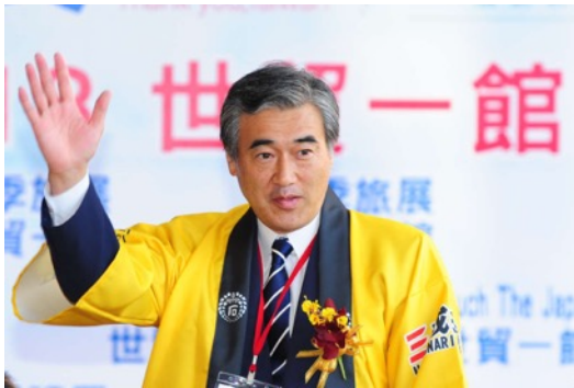
彦根市 市長 大久保 貴