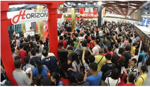
ベストブース賞同時受賞のホライゾンWiFi