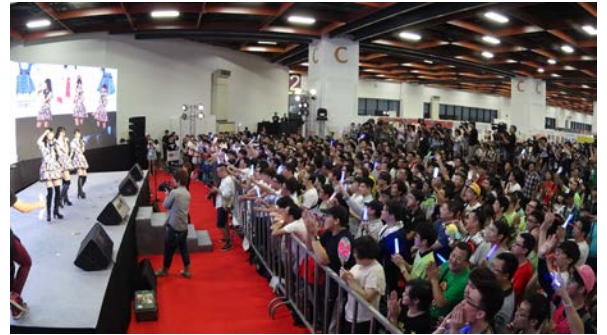
TTJメインステージでのAKB48