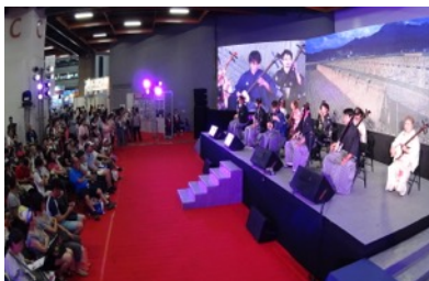
雅勝と台湾雅三絃会