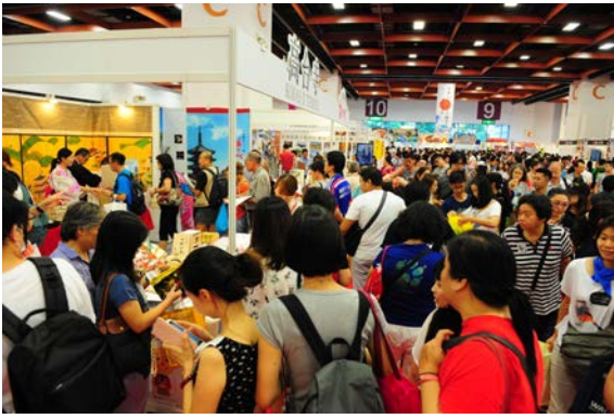
TTJ会場メインストリート