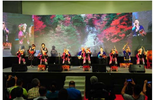
秋田県ブース前でのおやま囃子アトラクション