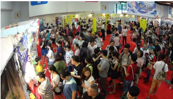
ベストサービス賞受賞の山形県牛肉ど真ん中駅弁の新杵屋