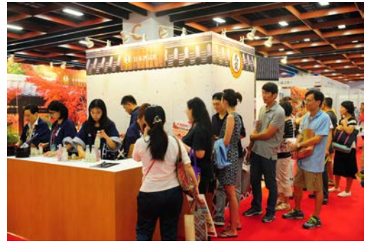
ベストブース賞同時受賞の大関