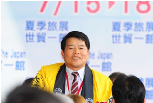
米原市 市長 平尾 道雄