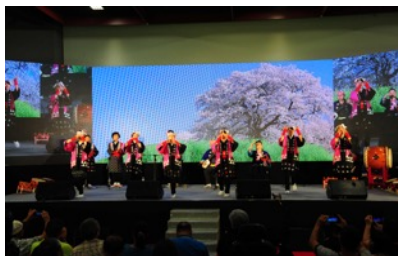
秋田県 おやま囃子