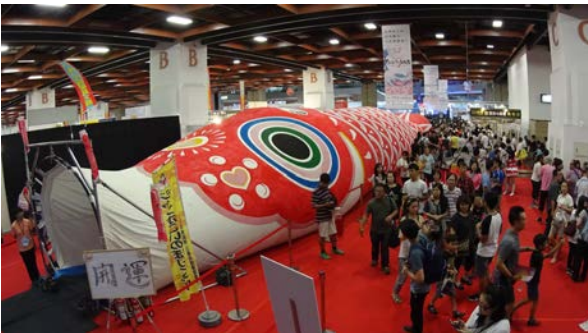
会場内に設置された巨大鯉のぼり