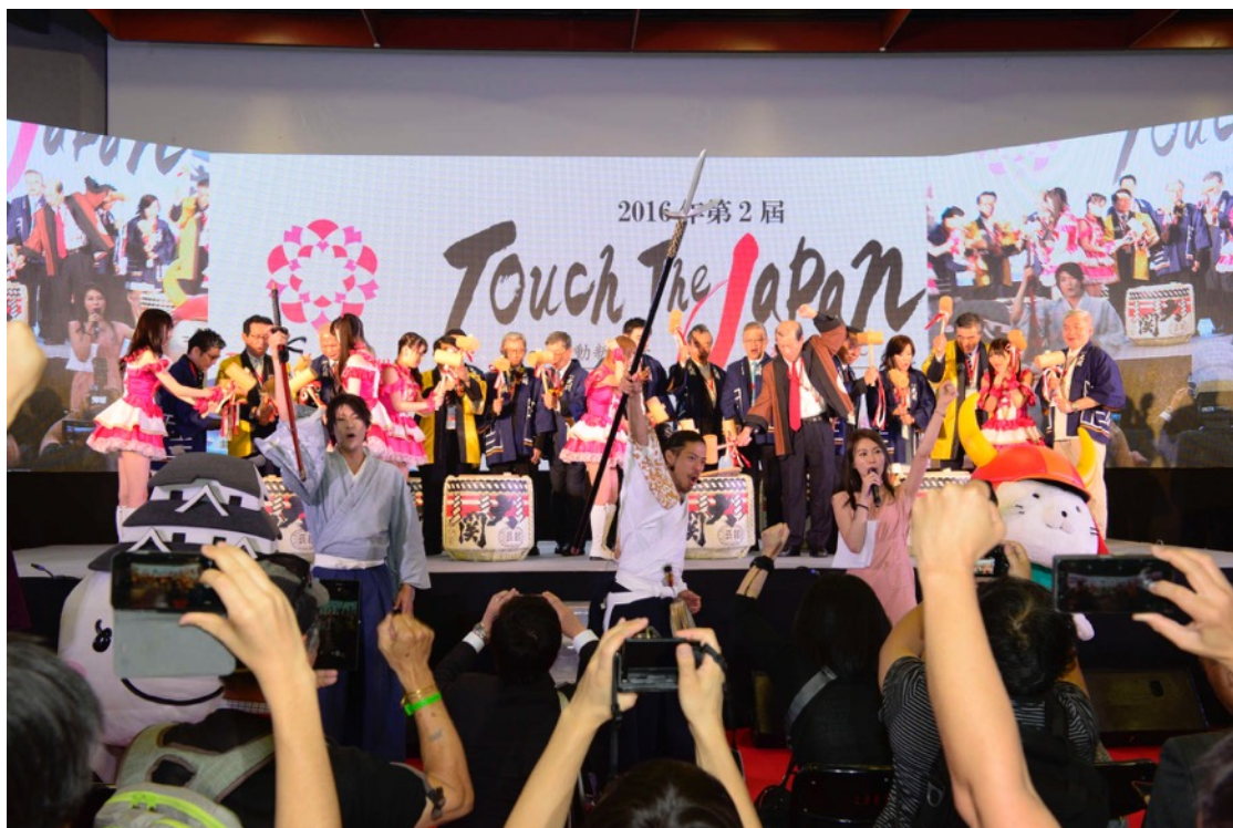
熊本県武将隊による掛け声で鏡割りが行われました。またアイドルグループReady To Kissや、ゆるキャラのひこにゃん、しるまるひめも参加して会場を盛り上げました。