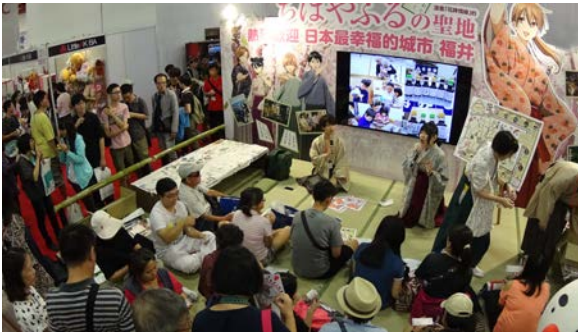
ベストプロモーション賞受賞の福井県