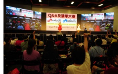
HORIZON WIFIのクイズ&じゃんけん大会