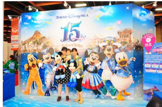
ディズニーランド出展ブース