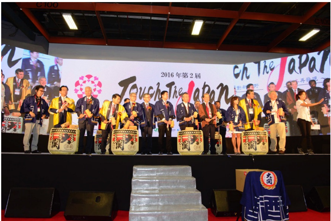
鏡開きにご登壇いただいたVIPの皆様(※順不同)