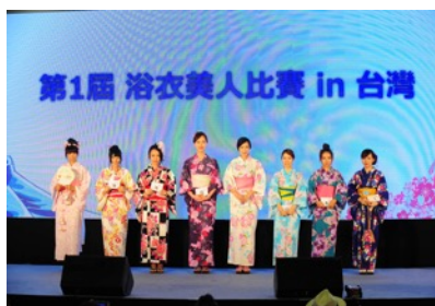
浴衣美人コンテストin台湾