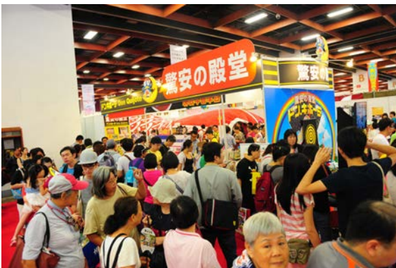
ドンキホーテ出展ブース