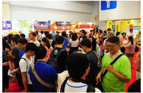
TTJ飲食エリア「日本楽食街」日本各地から14ブースの出展