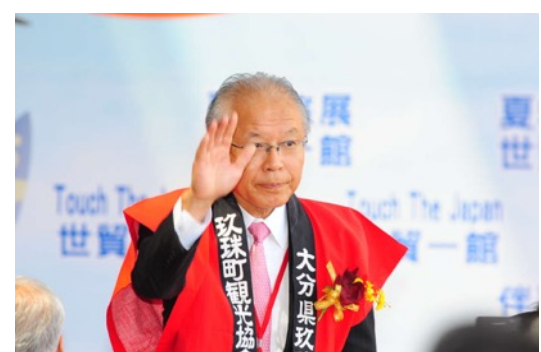
大分県 玖珠町 町長 朝倉 浩平