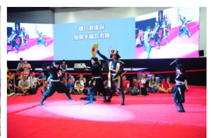
徳川家康と服部半蔵忍者隊