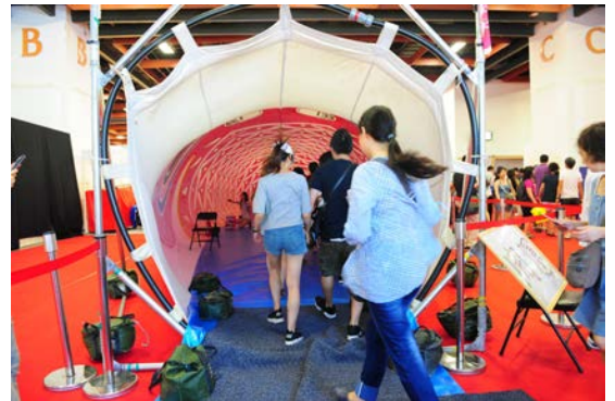
屋内での大分県玖珠町提供の開運巨大鯉のぼりくぐり