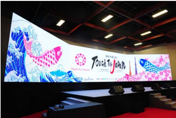
メインステージ巨大LEDスクリーン