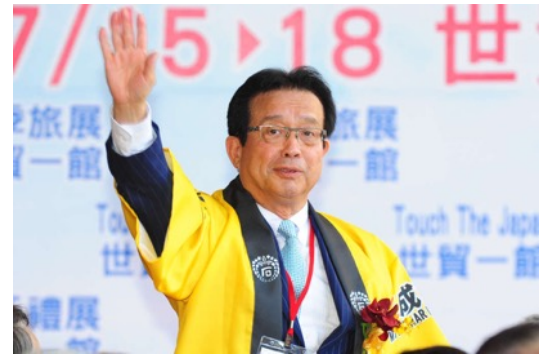
長浜市 市長 藤井 勇治