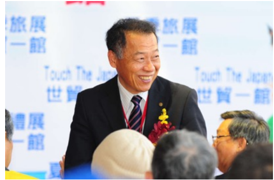
宮津市 市長 井上 正嗣