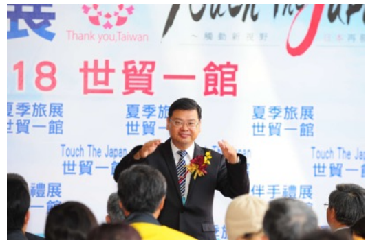
交通部觀光局 副局長 張錫聰