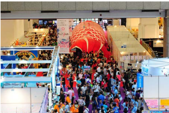
会場内に設置された巨大鯉のぼり