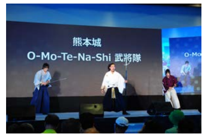
熊本城おもてなし武将隊