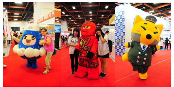
日本各地のゆるキャラが台湾に大集合