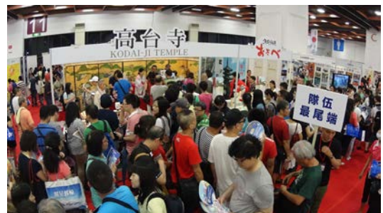
高台寺/おたべ出展ブース