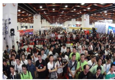
満員御礼のステージ観客